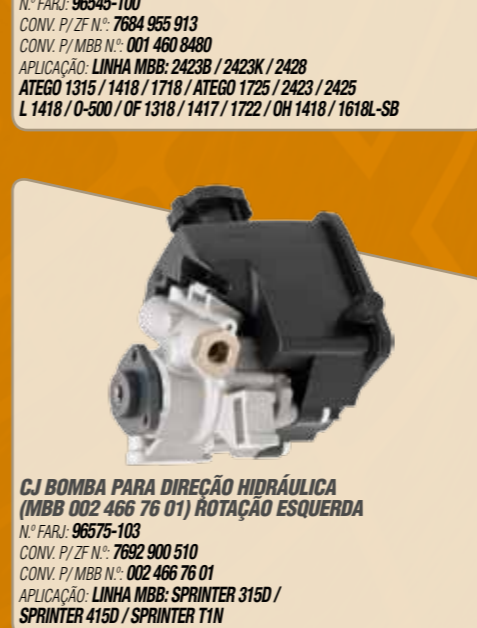
CJ BOMBA PARA DIREÇÃO HIDRÁULICA (MBB 002 466 76 01) ROTAÇÃO ESQUERDA Nº FARJ: 96675-103 CONV. P./ZF N.º: 7692 900 510 CONV. P./VECO N.º: 002 466 76 01 APLICAÇÃO: LINHA MBB: SPRINTER 3150 / SPRINTER 4150 / SPRINTER T1N