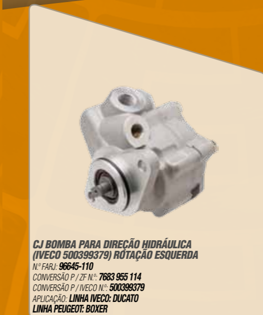
CJ BOMBA PARA DIREÇÃO HIDRÁULICA (IVECO 500399379) ROTAÇÃO ESQUERDA Nº FARJ: 96685-110 CONV. P./ZF N.º: 7683 955 114 CONV. P./IVECO N.º: 500399379 APLICAÇÃO: LINHA IVECO: DUCATO LINHA PEUGEOT: BOXER