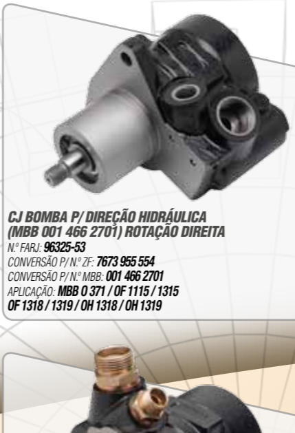
CJ BOMBA P/ DIREÇÃO HIDRÁULICA (MBB 001 466 2701) ROTAÇÃO DIREITA Nº FARJ: 96325-53 CONV. P./ZF N.º: 7673 955 554 CONV. P./MBB: 001 466 2701 APLICAÇÃO: MBB O 371 / OF 1115 / 1315 OF 1318 / 1319 / OH 1318 / OH 1319