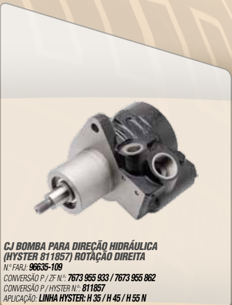
CJ BOMBA PARA DIREÇÃO HIDRÁULICA (HYSTER 811857) ROTAÇÃO DIREITA Nº FARJ: 96635-109 CONV. P./ZF N.º: 7673 955 933 / 7673 955 862 CONV. P./HYSTER N.º: 811857 APLICAÇÃO: LINHA HYSTER: H 35 / H 45 / H 55 N