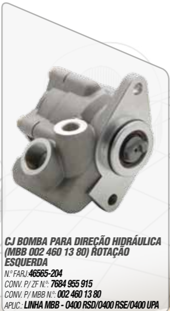
CJ BOMBA PARA DIREÇÃO HIDRÁULICA (MBB 002 460 13 80) ROTAÇÃO ESQUERDA Nº FARJ: 46565-204 CONV. P./ZF N.º: 7684 955 915 CONV. P./MBB N.º: 002 460 13 80 APLIC.: LINHA MBB - 0400 RSD/0400 RSE/0400 UP4