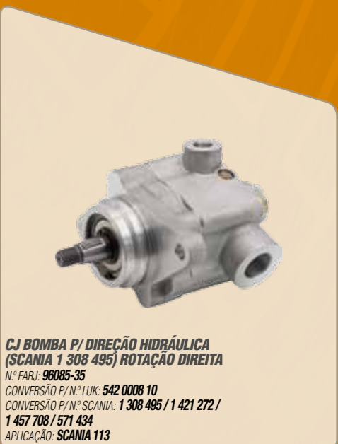
CJ BOMBA P/ DIREÇÃO HIDRÁULICA (SCANIA 1308 495) ROTAÇÃO DIREITA Nº FARJ: 96085-35 CONV. P./N.º: 542 0008 10 CONV. P./SCANIA N.º: 1308 495 / 1 421 272 / 1 457 708 / 571 434 APLICAÇÃO: SCANIA 113