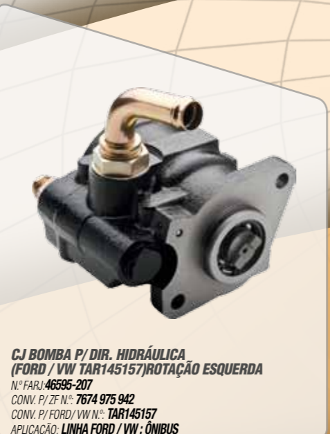
CJ BOMBA P/ DIR. HIDRÁULICA (FORD / VW TAR145157) ROTAÇÃO ESQUERDA Nº FARJ: 46595-207 CONV. P./ZF N.º: 7674 975 942 CONV. P./FORD / VW N.º: TAR145157 APLICAÇÃO: LINHA FORD / VW: ÔNIBUS