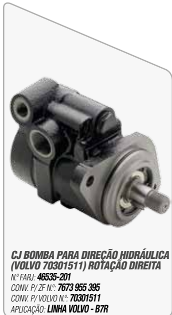
CJ BOMBA PARA DIREÇÃO HIDRÁULICA (VOLVO 70301511) ROTAÇÃO DIREITA Nº FARJ: 46535-201 CONV. P./ZF N.º: 7673 955 395 CONV. P./VOLVO N.º: 70301511 APLICAÇÃO: LINHA VOLVO - B7R