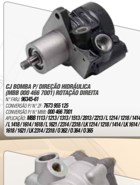
CJ BOMBA P/ DIREÇÃO HIDRÁULICA (MBB 000 466 7001) ROTAÇÃO DIREITA Nº FARJ: 96345-61 CONV. P./ZF N.º: 7673 955 125 CONV. P./MBB: 000 466 7001 APLICAÇÃO: MBB 1113 / 1213 / 1313 / 1513 / 2013 / 2213 / L 1214 / 1218 / 1414 / L 1418 / 1614 / 1618 / L 1621 / 2314 / 2318 / LK 1214 / 1218 / 1414 / LK 1614 / 1618 / 1621 / LK 2314 / 2318 / O 362 / O 364 / O 365