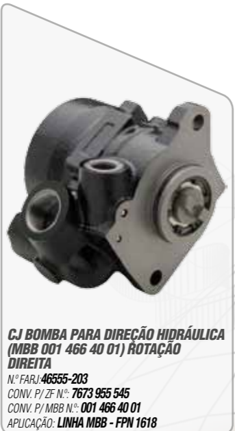
CJ BOMBA PARA DIREÇÃO HIDRÁULICA (MBB 001 466 40 01) ROTAÇÃO DIREITA Nº FARJ: 46555-203 CONV. P./ZF N.º: 7673 955 545 CONV. P./MBB N.º: 001 466 40 01 APLICAÇÃO: LINHA MBB - FPN 1618