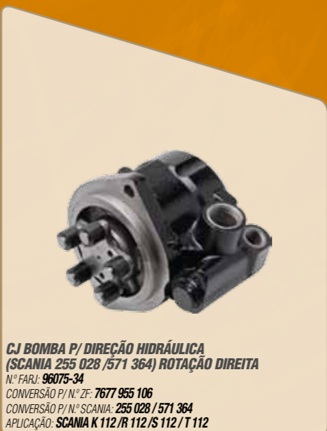
CJ BOMBA P/ DIREÇÃO HIDRÁULICA (SCANIA 255 028 / 571 364) ROTAÇÃO DIREITA Nº FARJ: 96075-34 CONV. P./ZF N.º: 7677 955 106 CONV. P./SCANIA N.º: 255 028 / 571 364 APLICAÇÃO: SCANIA K 112 / R 112 / S 112 / T 112