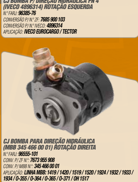
CJ BOMBA PARA DIREÇÃO HIDRÁULICA (MBB 345 466 00 01) ROTAÇÃO DIREITA Nº FARJ: 96655-101 CONV. P./ZF N.º: 7673 955 908 CONV. P./MBB N.º: 345 466 00 01 APLICAÇÃO: LINHA MBB: 1419 / 1420 / 1519 / 1520 / 1924 / 1932 / 1933 / 1934 / O-365 / O-364 / O-365 / O-371 / OH 1517