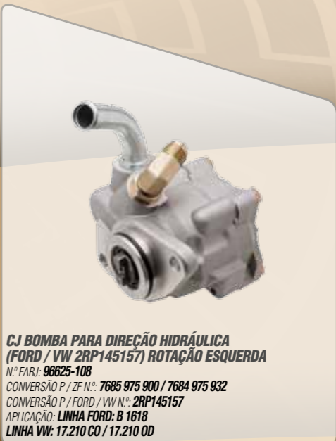
CJ BOMBA PARA DIREÇÃO HIDRÁULICA (FORD / VW 2RP145157) ROTAÇÃO ESQUERDA Nº FARJ: 96625-108 CONV. P./ZF N.º: 7685 975 900 / 7684 975 932 CONV. P./FORD / VW N.º: 2RP145157 APLICAÇÃO: LINHA FORD: B 1618 LINHA VW: 17.210 CO / 17.210 OD