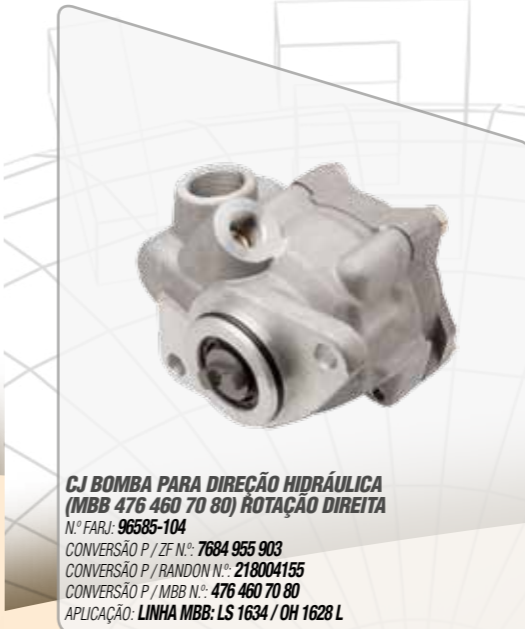
CJ BOMBA PARA DIREÇÃO HIDRÁULICA (MBB 476 460 70 80) ROTAÇÃO DIREITA Nº FARJ: 96585-104 CONV. P./ZF N.º: 7684 955 903 CONV. P./RANDON N.º: 218004155 CONV. P./MBB N.º: 476 460 70 80 APLICAÇÃO: LINHA MBB: LS 1634 / OH 1628 L