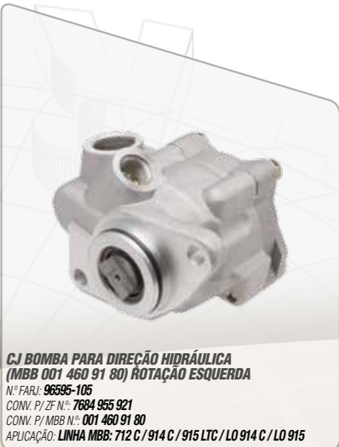
CJ BOMBA PARA DIREÇÃO HIDRÁULICA (MBB 001 460 91 80) ROTAÇÃO ESQUERDA Nº FARJ: 96595-105 CONV. P./ZF N.º: 7684 955 921 CONV. P./MBB N.º: 001 460 91 80 APLICAÇÃO: LINHA MBB: 712 C / 914 C / 915 LTC / LO 914 C / LO 915