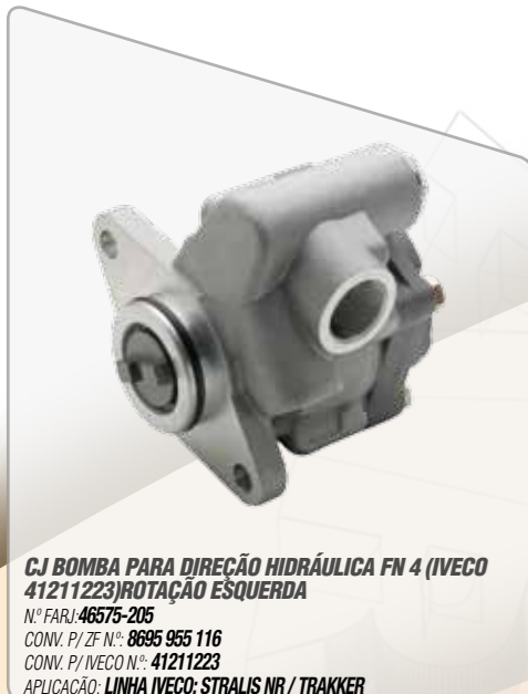
CJ BOMBA PARA DIREÇÃO HIDRÁULICA FN 4 (IVECO 41211223) ROTAÇÃO ESQUERDA Nº FARJ: 46575-205 CONV. P./ZF N.º: 8695 955 116 CONV. P./IVECO N.º: 41211223 APLICAÇÃO: LINHA IVECO: STRALIS NR / TRAKKER