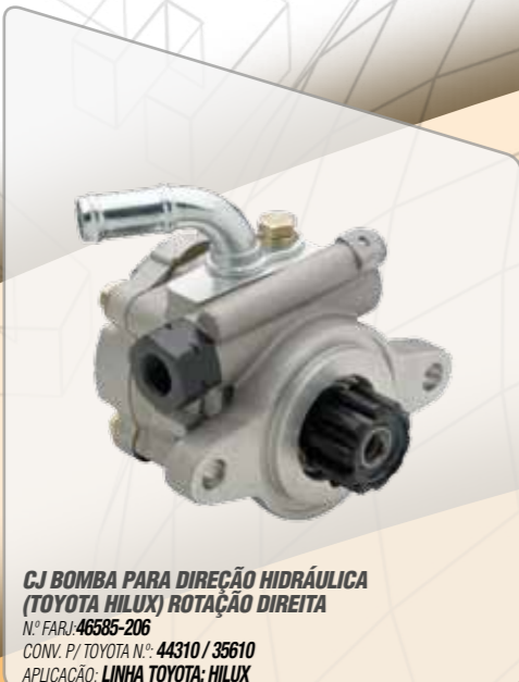
CJ BOMBA PARA DIREÇÃO HIDRÁULICA (TOYOTA HILUX) ROTAÇÃO DIREITA Nº FARJ: 46585-206 CONV. P./VECO N.º: 41211223 CONV. P./TOYOTA N.º: 44310 / 35610 APLICAÇÃO: LINHA TOYOTA: HILUX