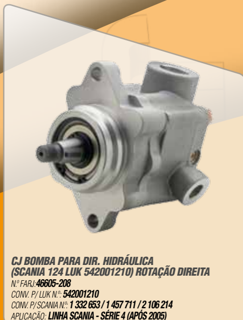
CJ BOMBA PARA DIR. HIDRÁULICA (SCANIA 124 LUX 542001210) ROTAÇÃO DIREITA Nº FARJ: 46605-208 CONV. P./LUX N.º: 542001210 CONV. P./SCANIA N.º: 1 332 653 / 1 457 711 / 2 106 214 APLICAÇÃO: LINHA SCANIA - SÉRIE 4 (APÓS 2005)