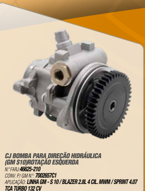
CJ BOMBA PARA DIREÇÃO HIDRÁULICA (GM S10) ROTAÇÃO ESQUERDA Nº FARJ: 46625-210 CONV. P./GM N.º: 7002657C1 APLICAÇÃO: LINHA GM - S 10 / BLAZER 2.8L 4 CIL. MVM / SPRINT 4.07 TCA TURBO 132 CV