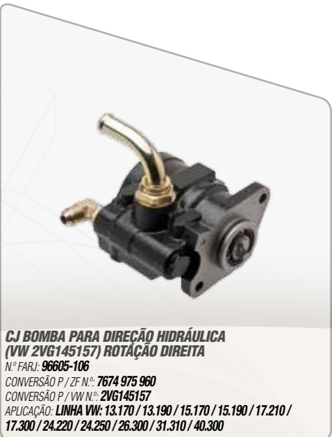
CJ BOMBA PARA DIREÇÃO HIDRÁULICA (VW 2VG145157) ROTAÇÃO DIREITA Nº FARJ: 96605-106 CONV. P./ZF N.º: 7674 975 960 CONV. P./VW N.º: 2VG145157 APLICAÇÃO: LINHA VW: 13.170 / 13.190 / 15.170 / 15.190 / 17.210 / 17.300 / 24.220 / 24.250 / 26.300 / 31.310 / 40.300