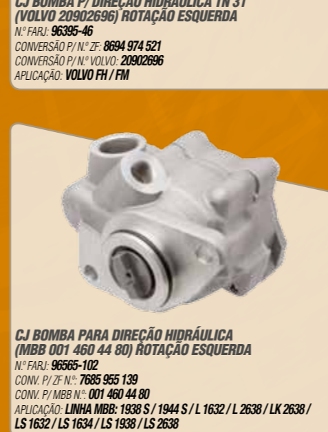
CJ BOMBA PARA DIREÇÃO HIDRÁULICA (MBB 001 460 44 80) ROTAÇÃO ESQUERDA Nº FARJ: 96665-102 CONV. P./ZF N.º: 7685 955 139 CONV. P./MBB N.º: 001 460 44 80 APLICAÇÃO: LINHA MBB: 1938 S / 1944 S / L 1632 / L 2638 / LK 2638 / LS 1632 / LS 1634 / LS 1938 / LS 2638