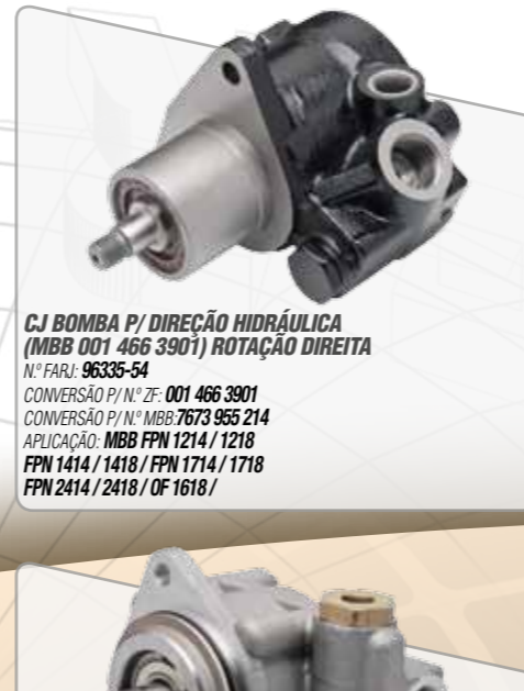
CJ BOMBA P/ DIREÇÃO HIDRÁULICA (MBB 001 466 3901) ROTAÇÃO DIREITA Nº FARJ: 96335-54 CONV. P./ZF N.º: 001 466 3901 CONV. P./MBB: 7673 955 214 APLICAÇÃO: MBB FPN 1214 / 1218 FPN 1414 / 1418 / OF 1115 / 1315 FPN 2414 / 2418 / OF 1618 /