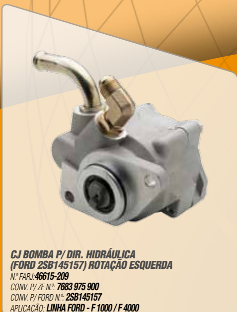
CJ BOMBA P/ DIR. HIDRÁULICA (FORD 2SB145157) ROTAÇÃO ESQUERDA Nº FARJ: 46615-209 CONV. P./ZF N.º: 7683 975 900 CONV. P./FORD N.º: 2SB145157 APLICAÇÃO: LINHA FORD - F 1000 / F 4000