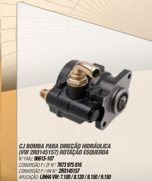
CJ BOMBA PARA DIREÇÃO HIDRÁULICA (VW 2R0145157) ROTAÇÃO ESQUERDA Nº FARJ: 96615-107 CONV. P./ZF N.º: 7673 975 816 CONV. P./VW N.º: 2R0145157 APLICAÇÃO: LINHA VW: 7.100 / 8.120 / 8.150 / 9.150