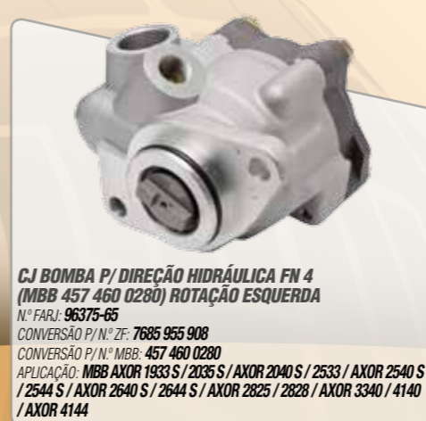
CJ BOMBA P/ DIREÇÃO HIDRÁULICA FN 4 (MBB 457 460 0280) ROTAÇÃO ESQUERDA Nº FARJ: 96375-65 CONV. P./ZF N.º: 7685 955 908 CONV. P./MBB: 457 460 0280 APLICAÇÃO: MBB AXOR 1933 S / 2036 S / AXOR 2040 S / 2533 / AXOR 2540 S / 2544 S / AXOR 2640 S / 2644 S / AXOR 2825 / 2828 / AXOR 3340 / 4140 / AXOR 4144