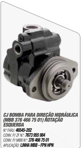
CJ BOMBA PARA DIREÇÃO HIDRÁULICA (MBB 376 466 75 01) ROTAÇÃO ESQUERDA Nº FARJ: 46545-202 CONV. P./ZF N.º: 7673 955 984 CONV. P./MBB N.º: 376 466 75 01 APLICAÇÃO: LINHA MBB - FPN HPN